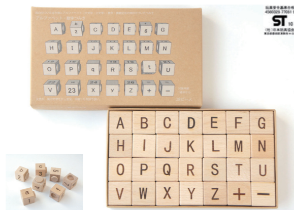
アルファベット・数字つみき 2,730円(税込)

正面：ひらがな50音図 背面：カタカナ50音図 右側面：数字(1~50) 左側面：ローマ字(A,I,U,E,O,K,S,T,N,H,M,Y,R,W) あ行：丸い凹みをつけています。 いうえ行：丸い凸凹をつけています。 お行：丸い凸みをつけています。