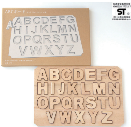
ABCボード 4cm セット ※A~Z,26文字とボードのセット 2,520円(税込)

文字仕様 正面：アルファベット大文字,+,− 背面：アルファベット小文字,÷,× 右側面：数字(1~26),=, 左側面：空白 最左列：丸い凸みをつけています。 中列：丸い凸凹をつけています。 最右列：丸い凹みをつけています。