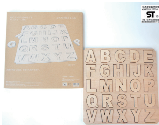
ABCボード 6cm セット ※A~Z,26文字とボードのセット 3,780円(税込)

AtoZ アルファベット 26文字セット 6cm ※A~Zの26文字セット 2,310円(税込)