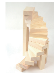
みんなのつみき 直方体セット 6,300円(税込)