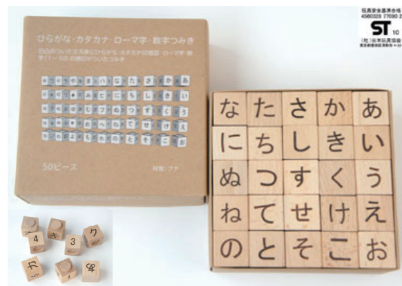
ひらがな・カタカナ・ローマ字・数字つみき 3,360円(税込)

積木サイズ：1辺3cm (50個組み) 材質：ブナ 対象年齢：1歳半(18ヶ月)以上